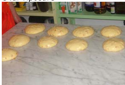
e far riposare