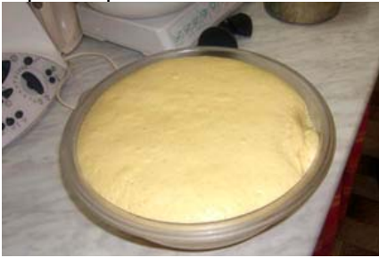
Il pre-impasto lievitato