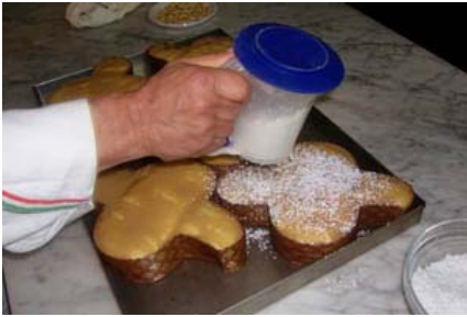
zucchero a velo