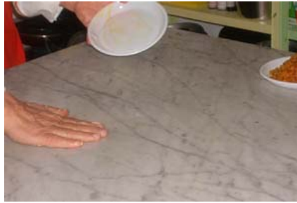
ricordarsi di oleare bene il tavolo