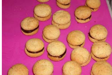
Baci di dama farciti con nutella

6° lezione corso di pasticceria (terza parte)