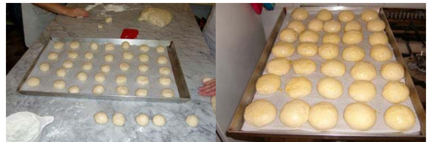
panini prima della lievitazione dopo la lievitazione

Impastare la farina con tutti gli ingredienti e metà del latte, aggiungere per ultimo il lievito spezzettato e continuare ad aggiungere il restante latte. Lavorare con la planetaria per un quindicina di minuti e poi continuare a lavorare la pasta sul tavolo. Formare le palline (30 g circa). Ricordarsi di schiacciare le palline con le mani prima di metterle a lievitare, altrimenti si sollevano a campana. Le palline si fanno nell'incavo della mano con il pollice e l'indice. Si mettono a lievitare dentro il forno precedentemente riscaldato a 35° per 20 minuti circa. A lievitazione ultimata spennellare con l'uovo, e cuocere a 230-250° per 12-15 minuti in forno ventilato.