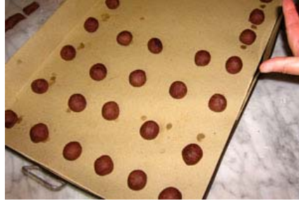
le palline al cacao