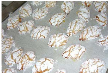
ed ecco i ricciarelli cotti