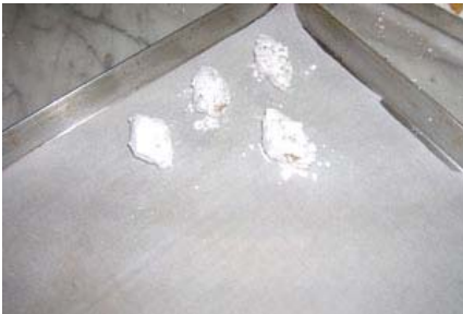
sulla teglia crudi