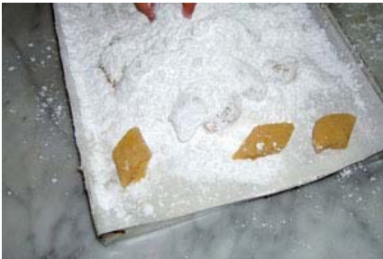
ecco i primi ricciarelli, un po' sbilenchi..