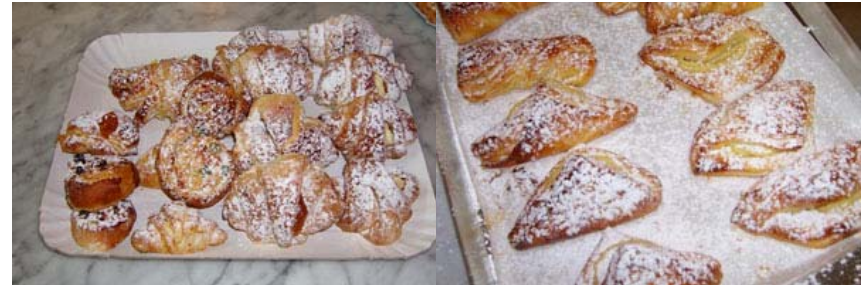
i croissant lievitati

Dare le forme desiderate e mettere a lievitare in camera di lievitazione (forno riscaldato a 30° C-50°) per circa 45 minuti. Una volta lievitate spennellare con l'uovo ed infornare a 180-220°. Cottura circa 10-15 min. girare i lati delle teglie.