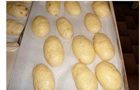
dopo la lievitazione