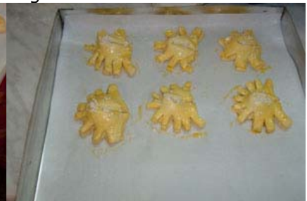
le creste di gallo