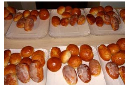
panini dolci glassati