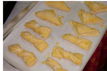
i saccottini e cravattine