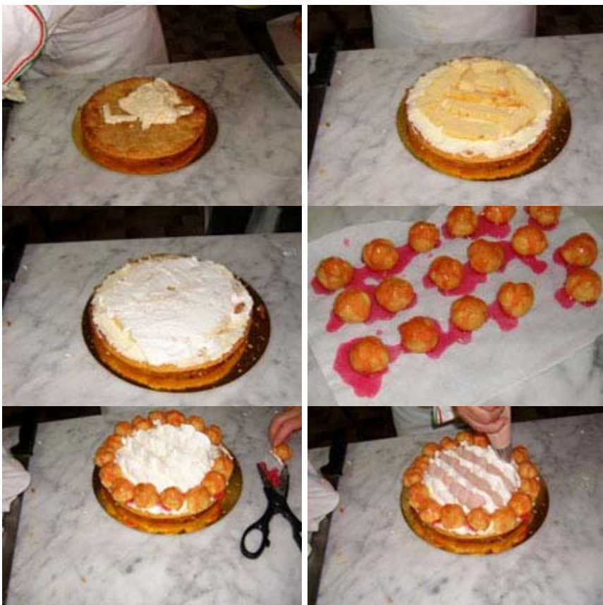
torta Saint Honore completata