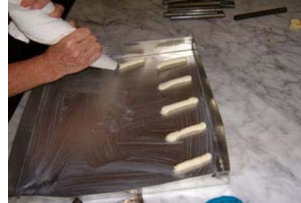
arrotolata tipo "sigaretta"

mani. Aspettare un attimo e poi toglietele dal matterello e avrete le lingue curvate tipo patatine appunto.