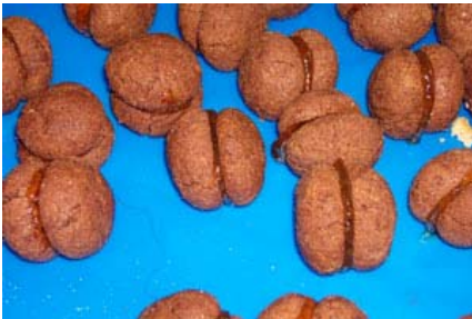
baci di dama farciti con marmellata