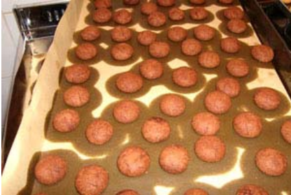
baci al cacao cotti